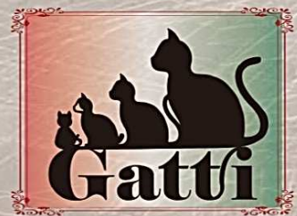
名古屋市東区白壁 イタリアンドルチェ Gatti (ガッティ)